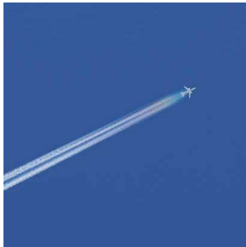
▲ Fotografía: José Roberto Arango

Artículo 76.º- Por medio de programas educativos se ilustrará a la población sobre los efectos nocivos de las quemas para desmonte o limpieza de terrenos y se presentará asistencia técnica para su preparación por otros medios. En los lugares en donde se preste la asistencia, se sancionará a quienes continúen con dicha práctica a pesar de haber sido requeridos para que la abandonen.