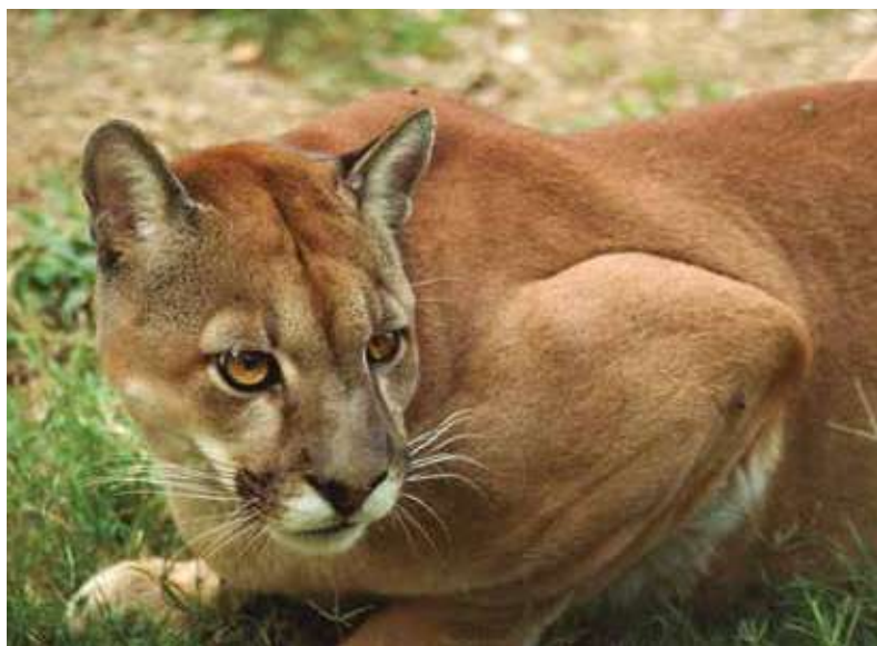
▲ Fotografía: Eduardo Sandoval