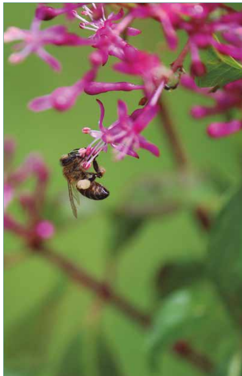
▲ Fotografía: José Roberto Arango

Corte Constitucional. Sentencia C-495 de 1996. Expediente No. D-1285 Magistrado ponente Dr. Fabio Morón Díaz. Bogotá D.C., 26 de septiembre de 1996.