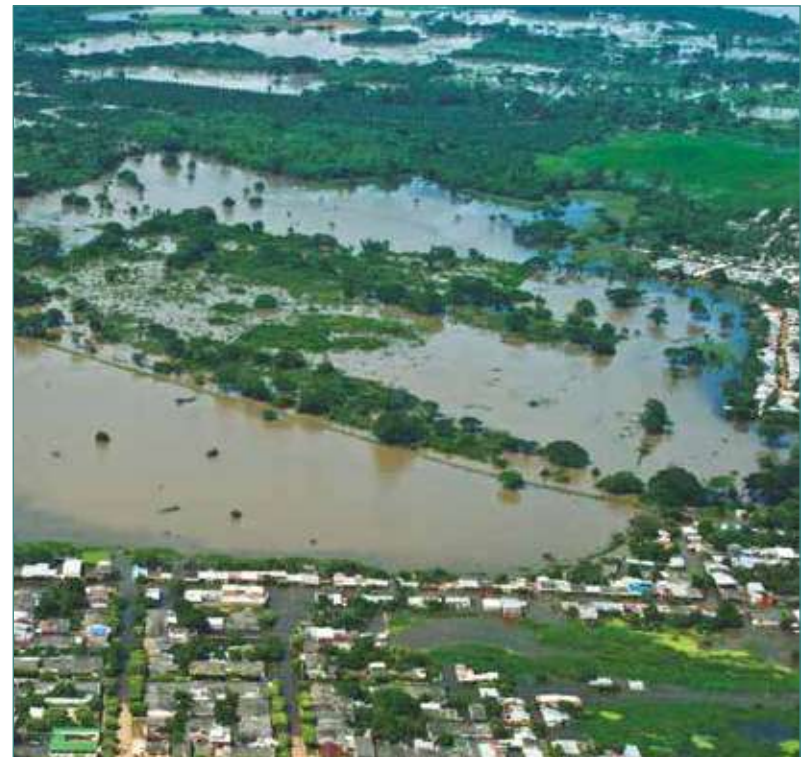
▲ Fotografía: Archivo Ministerio de Ambiente y Desarrollo Sostenible

Corte Constitucional. Sentencia C-216 de 2011. Expediente No. RE-197. Magistrado ponente Dr. Juan Carlos Henao Pérez. Bogotá D.C., 29 de marzo de 2011. Corte Constitucional. Sentencia C-156 de 2011. Expediente No. RE-171. Magistrado ponente Dr. Mauricio González Cuervo. Bogotá D.C., 9 de marzo de 2011.