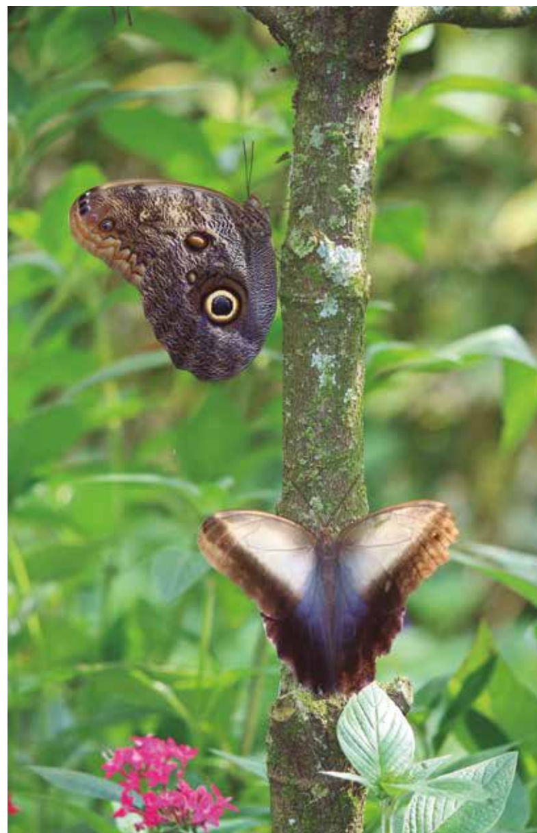
▲ Fotografía: José Roberto Arango

Decisión 391 de la Comisión del Acuerdo de Cartagena Régimen Común sobre Acceso Recursos Genéticos