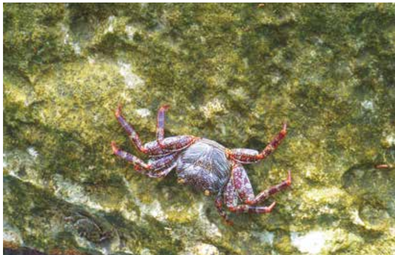
▲ Fotografía: José Roberto Arango

Declaradas EXEQUIBLES la Ley 357 del 21 de enero de 1997 y la "Convención Relativa a los Humedales de Importancia Internacional Especialmente como Hábitat de Aves Acuáticas", suscrita en Ramsar (Irán) el 2 de febrero de 1971 mediante la Sentencia C-582/97 del 13 de noviembre 1997. Magistrado ponente Dr. José Gregorio Hernández Galindo.